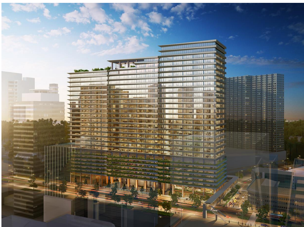
【The Yuchengco Centre 外観パース】

双日株式会社（以下「双日」）は、このたび、フィリピン大手財閥ユーチェンコグループ傘下の主要企業である House of Investments, Inc.（以下「HOI」）が進めるオフィスビル再開発事業「 ジ ユーチェンコ センター The Yuchengco Centreプロジェクト」（以下「本案件」）に参画すべく、HOI傘下の特別目的会社である サン ロレンツォ ルイズ San Lorenzo Ruiz Investment Holdings & Services, Inc.（以下「SLR」）に対し、約60億円の増資引き受けおよび株式取得をおこないました。