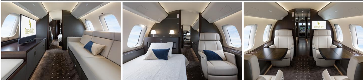
【ボンバルディア社の最新機種「Global 7500」】