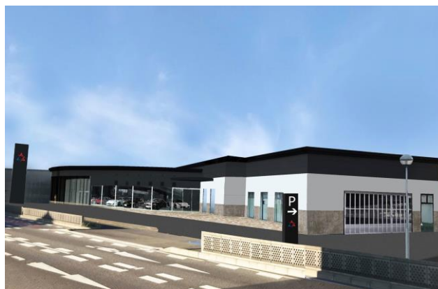
【名古屋店ショールームのイメージ図】

2019年4月に清須市に名古屋店、安城市の安城店の2店舗を開設しました。名古屋店では、プレミアムブランドの中古車を販売します。双日は、長年にわたり国内外で認定ディーラーを運営しており、今般、三和サービスグループの事業基盤とネットワークを活用し、新たに東海地区へ参入することで、双日が注力分野として掲げる自動車ディーラー事業において、更なる安定収益基盤を構築していきます。