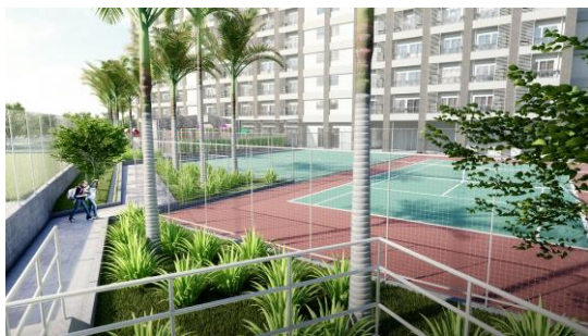
テニスコート・フットサルコート