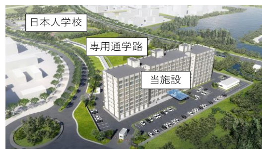
日本人学校への専用通学路