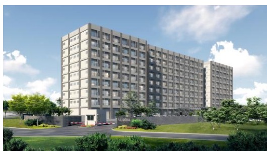
北側からの当施設外観

この事業を通じ、両社が一体となり、インドネシアでJapan Quality(日本品質)の安全・安心の住環境を提供することで、現地に住まう方々の暮らしの更なる質向上に貢献してまいります。