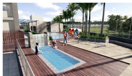
屋外キッズプール