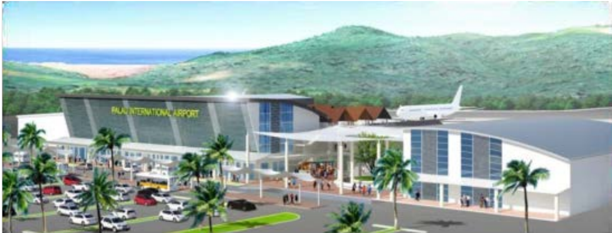
【パラオ国際空港の完成予想図】