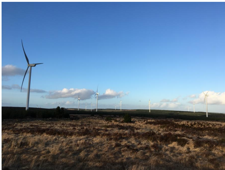
【エヴァレイアー社の風力発電所】