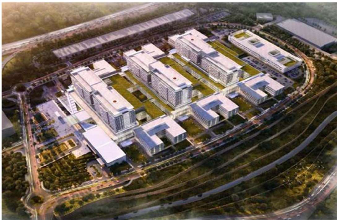
【病院の完成予想図】

双日株式会社は、100%子会社を通じて、トルコにおいて病院施設運営事業に参画します。トルコの大手建設会社であるルネサンスグループと共同で事業会社を設立し、イキテリ（İkitelli）総合病院（所在：トルコ イスタンブール市、病床数：2,682床）の施設運営を行います。日系企業が施設運営に関与する単一の病院としては、国内外含め最大規模となります。