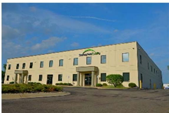
【ストラトスフィア・クオリティ本社】

ストラトスフィア・クオリティは、グリーンテックと同様に自動車メーカーや自動車部品メーカー等を顧客とし、部品等の品質検査を主業とする大手サービスプロバイダーであり、2009年の創業以来の高成長を継続し、北米で約3,000社の顧客基盤を有しております。