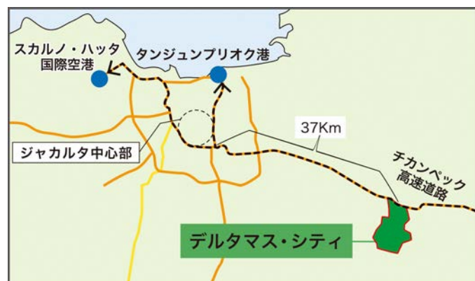
デルタマス・シティ立地図

デルタマス・シティはジャカルタから約 37 km 地点の副都心エリアに位置し、ブカシ県庁やバンドン工科大学院（予定）などの行政・教育施設が充実。さらに、ASEAN 最大級のイオンモールの開店も予定されているなど、豊かな都市機能を備えた魅力ある街です。