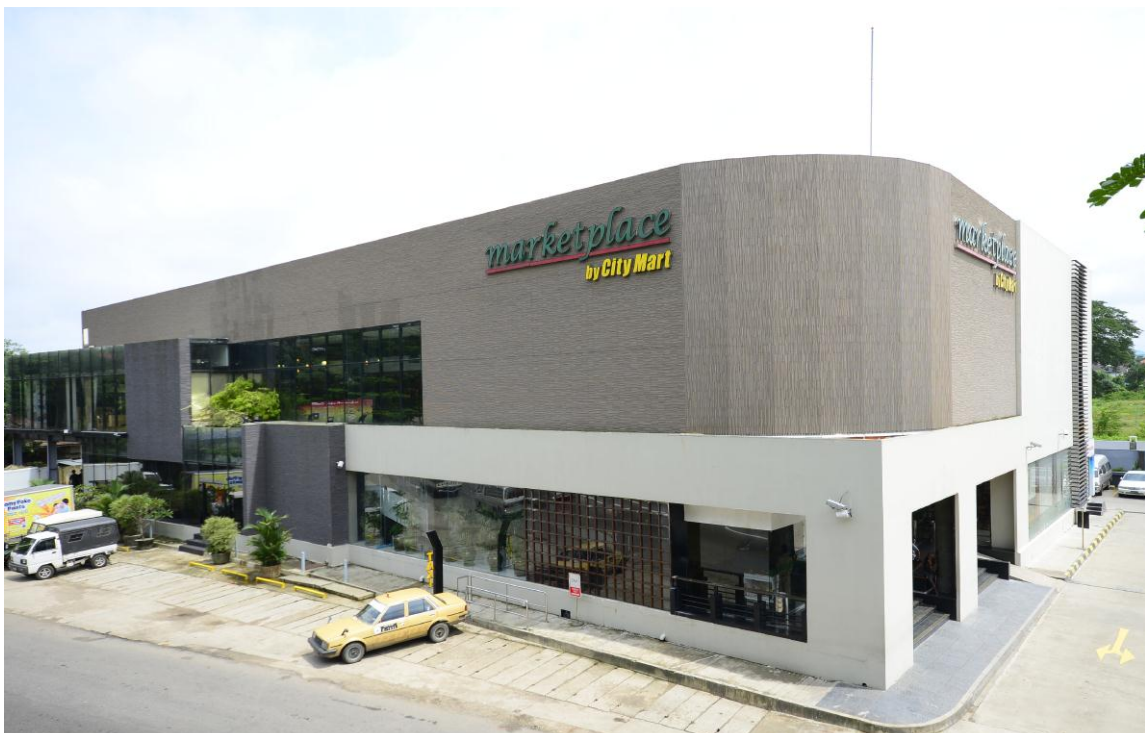
【シティー・マート マーケットプレイス店】

CM グループは、ヤンゴンを中心にスーパーマーケット 15 店、量販店 5 店、コンビニ 20 店を有する小売事業や、ヤンゴン・マンダレー・ネピトー等の主要都市で生活消費財・食品の卸売事業を展開する同国最大の流通事業グループです。同グループのプレミアム・ディストリビューション社（Premium Distribution Co., Ltd：本社ヤンゴン）は、食品を中心とした卸売事業を展開しており、ヤンゴンを中心に約 500 社の顧客ネットワークを有しております。同グループでは、急成長を続ける市場のニーズに対応するために、海外輸入品の更なる充実と卸売・物流のオペレーションの近代化・効率化及びコールドチェーンの強化を進めております。