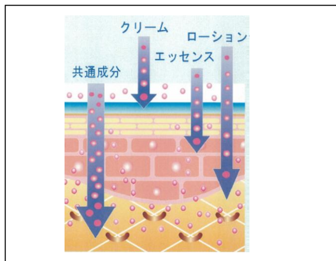
【角質層まで (イメージ図)】

美容効果に優れた成分をナノカプセルに内包することにより、さらに効果的にお肌に浸透させることができ、高いスキンケア効果の発揮が期待されます。また、ローション、エッセンス、クリームそれぞれが作用するポイントが違うため、3商品をラインでお使い頂くことにより、お肌全体を余すことなくカバーできます。