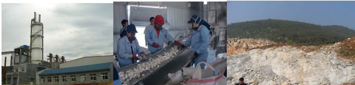
【青陽海億石灰製造工場・石灰鈹山画像】

両社は、青陽海億社の親会社である香港順遠投資有限公司と共同で新規に持株会社 サンライムリミテッド (Sunlime ltd.) を設立し、2社合計の出資比率を 51%（双日 43.77%、宇部マテリアルズ 7.23%）とします。出資額は合計で 850 万ドル（日本円約 7 億円）です。