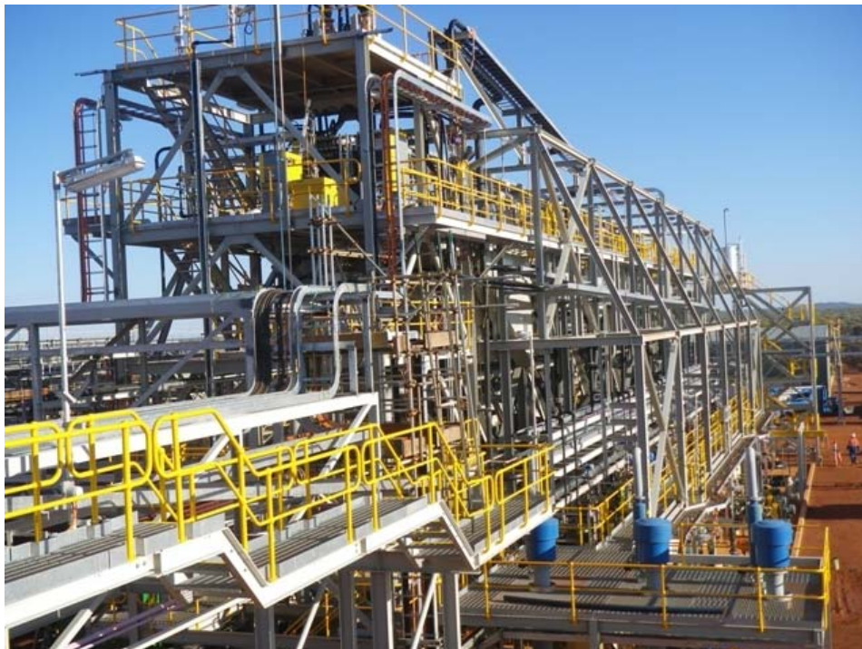
【マウント・ウェルド鉱山に完成したレアアース選鉱プラント】

第1フェーズは、投資総額5億4千万米ドル（約440億円）、生産能力11,000トン／年で、2011年第3四半期より操業を開始する予定としており、現在、世界で進められているレアアース開発プロジェクトの中で、最も早く操業および商業生産を行うプロジェクトの一つです。2011年末には、ジジムやセリウム、ランタン等のレアアース製品が日本向けに供給される見込みです。