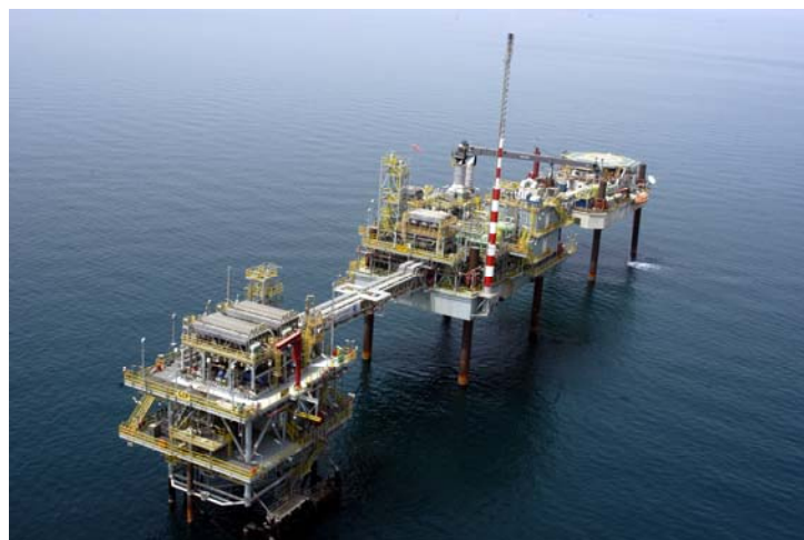
【カタール国沖合東南第一鉦区プラットフォーム】

カタール国沖合東南第一鉦区権益は、1997年に旧日商岩井株式会社(現・双日)とコスモ石油株式会社がカタール国営石油会社との間で生産分与契約を締結し、カタール石油開発株式会社に権益を譲渡したものです。2006年3月より同鉦区内のアルカルカラ油田およびA構造北部油田から原油生産を開始、2009年12月末まで生産量は日量約6000バレルで推移しました。さらに、現在、同鉦区内の第3の油田であるA構造南部油田を開発中で、原油の生産開始後、同鉦区全体の日量生産量は約10000バレルに増産する見込みです。