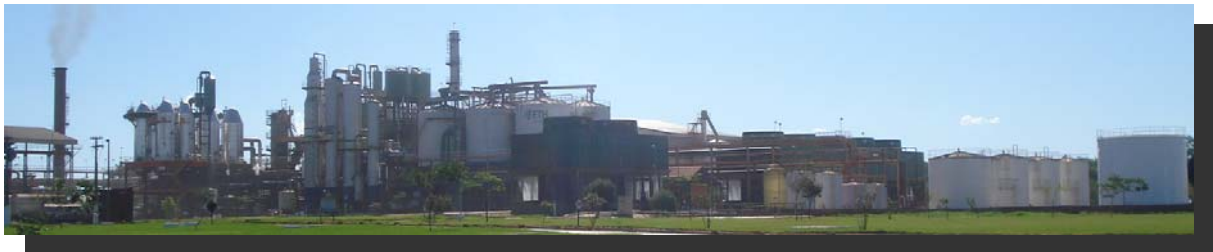
【南マトグロソ州エルドラド（Eldorado）工場】