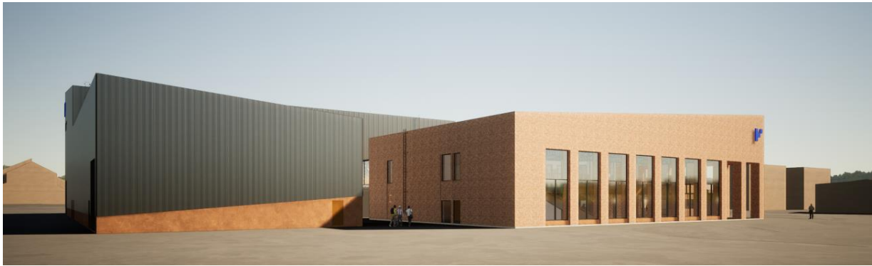
【建設中のデモスケールプラントの完成予想図】

Hycamite は今回調達した資金を活用し、水素換算で年産 2,000 トン規模（約 2,880Nm 3 /h）のデモスケールプラント建設を計画しています。既にパイロットレベルでの技術実証は完了しており、フィンランド中部のコッコラ工業団地内にて 2024 年中頃の稼働開始を予定しています。